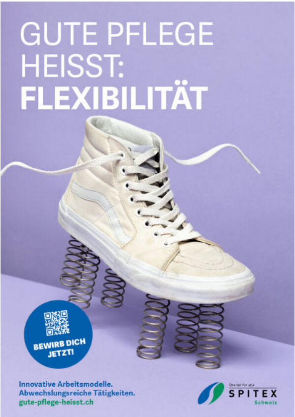
Beispiel aus der Image-Kampagne der Spitex 2024