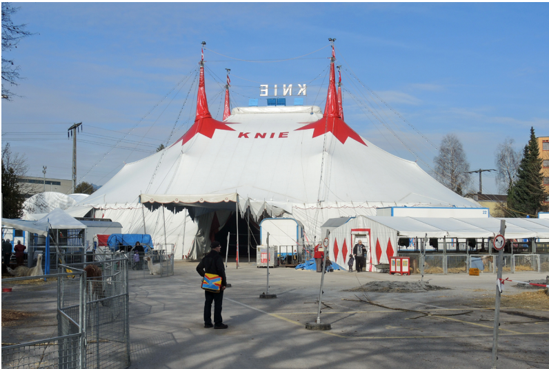
Der Zirkus Knie im Rapperswiler Quartier, 2013