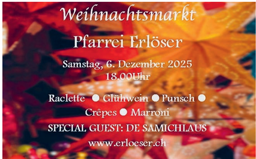
Foto: Plakat Weihnachtsmarkt in Erlöser

Jedes Jahr ziehen in vielen Pfarreien, auch in der Pfarrei Erlöser, Gruppen von Kindern durch die Quartiere, gekleidet wie Könige schreiben sie mit Kreide den Segen 20*C+M+B+26 auf die Haustüre. «Christus Mansionem Benedicat», Christus segne dieses Haus. Dieser Segen soll das Haus und seine Bewohner unter den Schutz Gottes stellen.