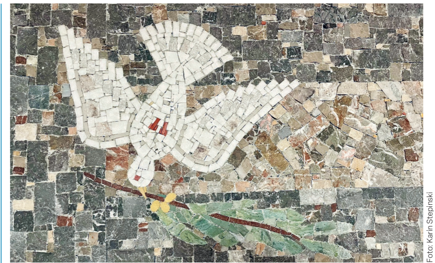
Frohe Pfingsten mit dem Mosaik aus unserer Kirche!

Diese wird am Montagabend, 18. Mai 2026, abgehalten. Traditionsgemäss findet zuerst um 19.00 Uhr in der Kirche ein Gedenkgottesdienst für die verstorbenen Vereinsmitglieder statt. Alle Gottesdienstbesucher, wozu auch die Angehörigen sowie die Gäste der Vereinsanlässe des Jahres 2025 willkommen sind, treffen sich anschlies-