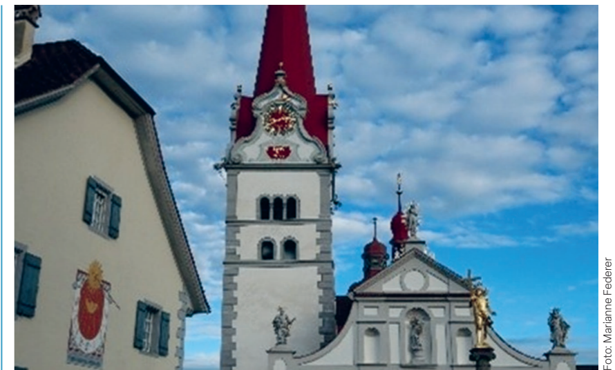
Kirche in Beromünster

«Pilgernde der Hoffnung» – unter diesem Motto hat Bischof Joseph