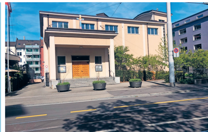
Parrocchia S. Giovanni Bosco MCLI