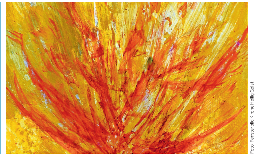
Foto: Fensterbild Kirche Heilig Geist