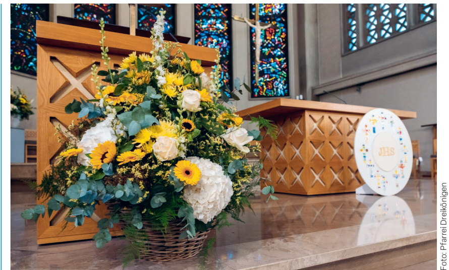
Blumenarrangement zur Erstkommunion 2025 in der Kirche Dreikönigen.