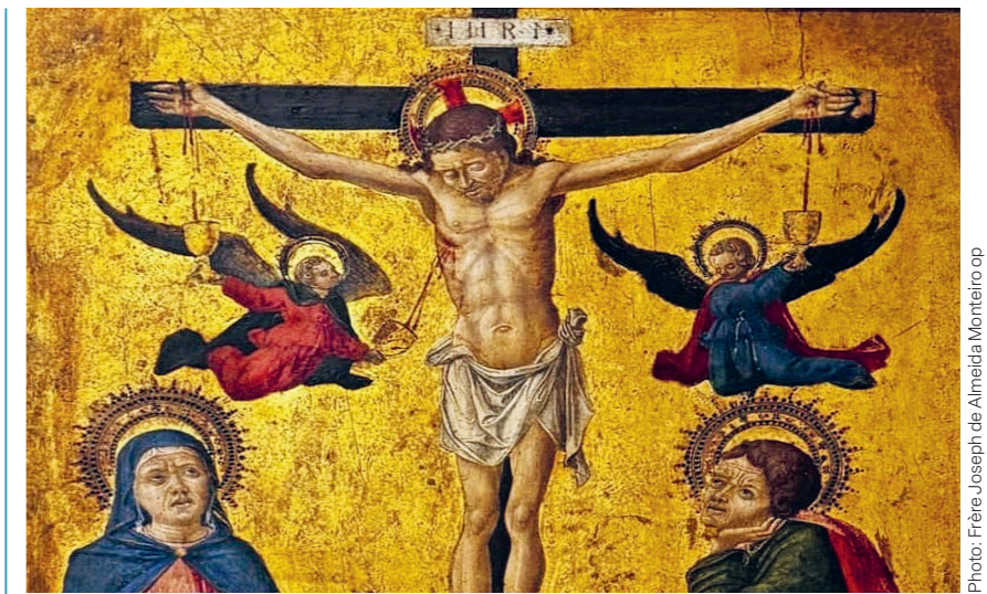
La crucifixion, Musée des beaux-arts à Bâle

Puisqu'il faut revenir au cœur, le n° 9 rappelle le contexte ecclésial : « Dans ce monde liquide, il est nécessaire de parler à nouveau du cœur, d'indiquer le lieu où toute personne, quelle que soit sa catégorie et sa condition fait sa synthèse, là où l'être concret trouve sa source et la racine de toutes ses autres forces, convictions, passions et choix. Mais nous évoluons dans des sociétés de consommateurs en série vivant au jour le jour, dominés par les rythmes et les bruits de la technologie, et qui n'ont pas une grande patience pour accomplir les processus que l'intériorité requiert. » Et le pape termine ce paragraphe par cette phrase : le cœur fait défaut. Il est rappelé que la dévalorisation du centre intime de l'homme et donc du cœur vient de très loin : puisqu'on la trouve déjà dans le rationalisme grec et préchrétien, dans l'idéalisme postchrétien et dans le matérialisme. Les concepts tels que la raison, la volonté et la liberté ont été privilégiés par rapport au cœur (n° 10).