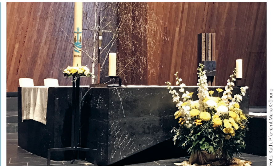
Maria Krönung zur Osterzeit

Die Kinder der vierten Primarklassen durchlaufen zum ersten Mal den Versöhnungsweg in St. Anton und feiern gemeinsam mit den Kindern der fünf-