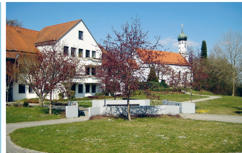
Familienferien Herz Jesu Wiedikon 2027 in der Oase Steinershausen