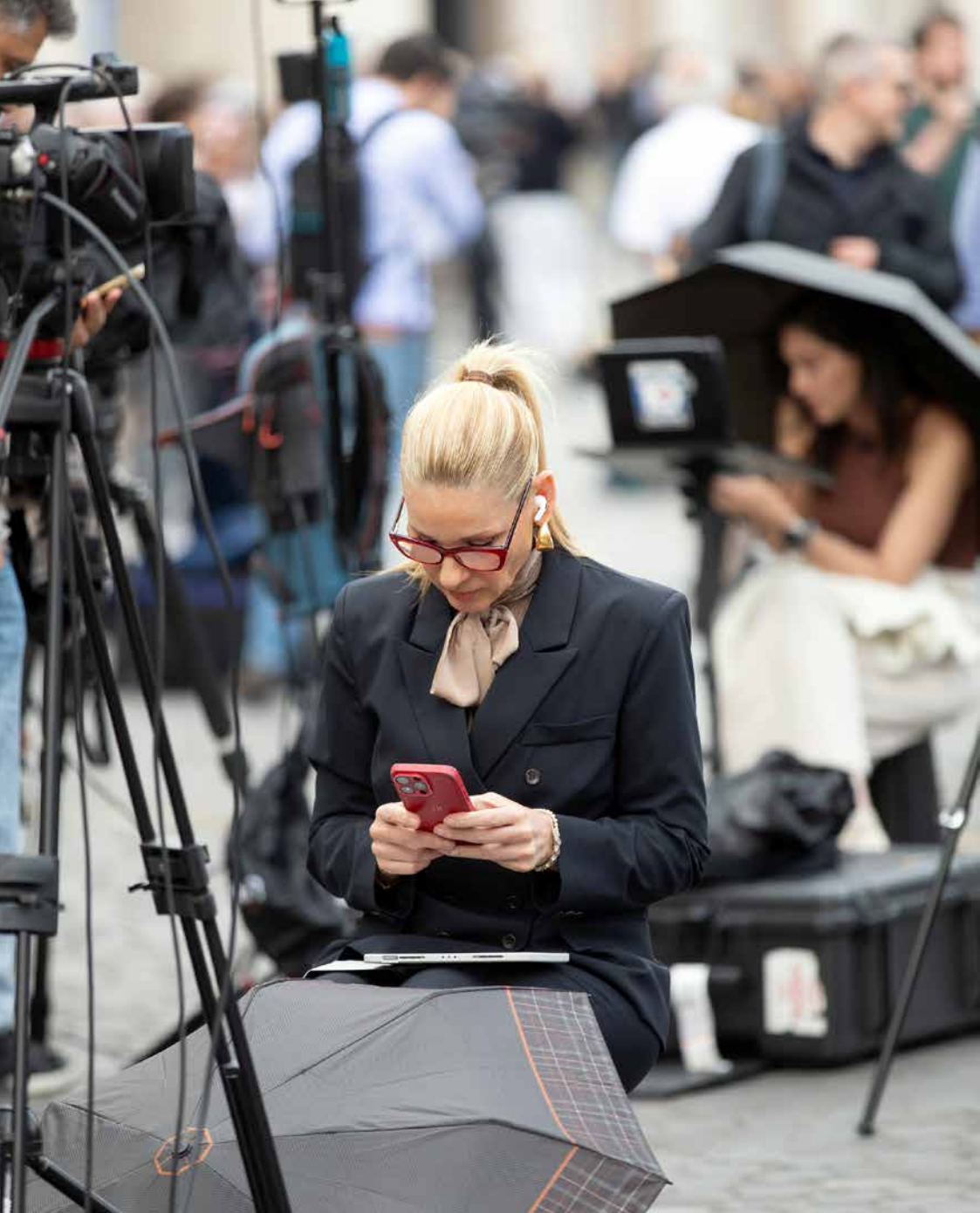
Eine Journalistin wartet auf dem Petersplatz in Rom auf die Verkündigung des neuen Papstes. Entstanden im Rahmen der Reportage «Schweizer in Rom». Ausgabe 7/2025